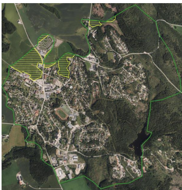
Figur 2: Grønn strek viser Skjønnhaugs utviklingsgrense fram mot 2050. Gulskravert er i konflikt med jordvern.

for delmål Jordvern i samfunnsdelteksten (pkt. 24-28). Eksempel er Figur 2, kartet over Skjønnhaug: Store skrinne skogsarealer med lavbonitetsskog og lite konfliktpotensial er tilgjengelig mot øst. Likevel tar man med gult skraverte jordbruksarealer. Dette er et uheldig signal til kommunen!